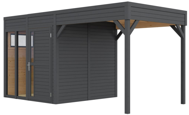
Behandlung: ANTHRAZIT (RAL 7016)

Nachbehandlungen können mit beliebigen Farbtönen erfolgen.