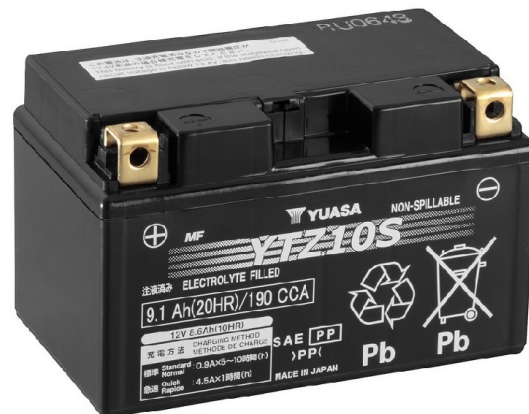
For Illustration Purposes Only