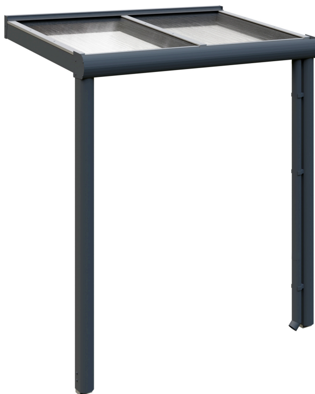
VORDACH GREIFSWALD 216 x 135 cm

Dacheindeckung Polycarbonat-Doppelstegplatte in klar