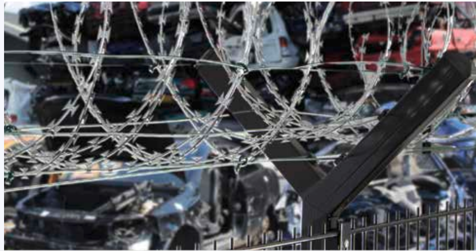
Stacheldrahtabweiser 45° in Anthrazitgrau beschichtet.

Alle drei Varianten werden in die Pfosten eingesteckt und bieten somit auch die Möglichkeit, bestehende Zaunanlagen komfortabel nachzurüsten.